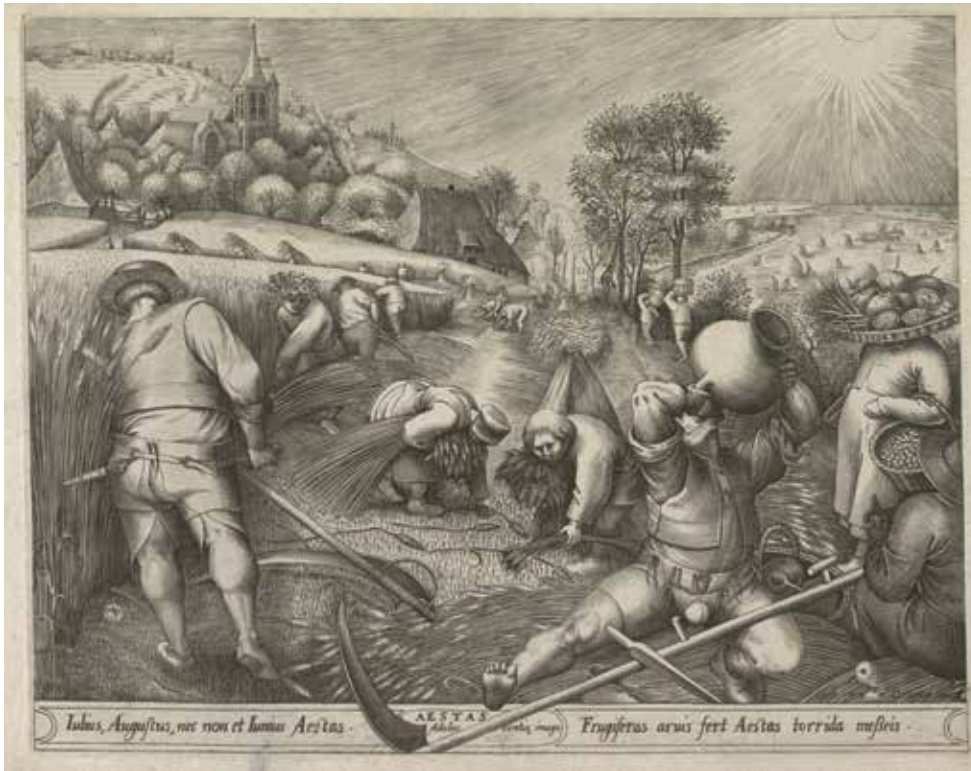
Pieter van der Heyden naar Pieter Bruegel, De zomer (detail), 1570 AMSTERDAM, RIJKSMUSEUM