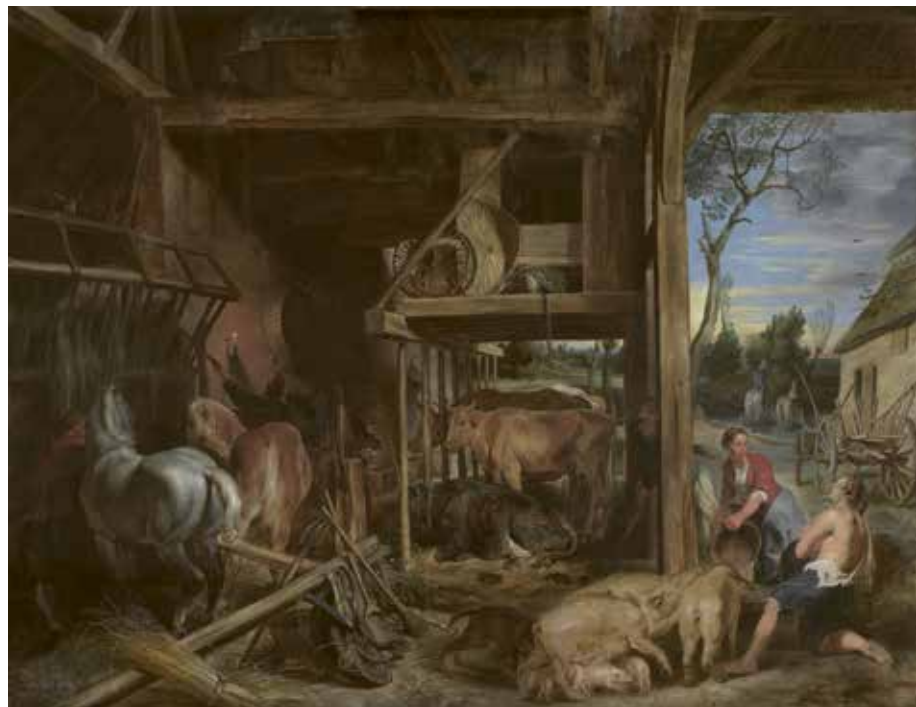
Peter Paul Rubens, De verloren zoon, 1618, olieverf op paneel, 108 x 156 cm ANTWERPEN, KONINKLIJK MUSEUM VOOR SCHONE KUNSTEN

Naast een rechtstreekse overname van een kunstvoorwerp laat Vandersteen zich ook inspireren door Vlaamse meesters. Zijn grote lieveling is Pieter Bruegel die met zijn schilderijen en gravures meermaals in Suske en Wiske opduikt. Een eerste keer tekent hij present in Suske en Wiske op het eiland Amoras (1945-1946). Het hoofdstadje van Amoras – gesticht in 1541 – herinnert dan weer sterk aan de fictieve stadswijk Oud Antwerpen op de Wereldtentoonstelling te Antwerpen van 1894. Enkele jaren later debuteert Vandersteen in het weekblad Tintin/Kuifje met Het Spaanse Spook (1948). Hier is het werk van Bruegel op talloze plaatjes te vinden, soms gemakkelijk te herkennen, nog vaker verborgen in een motief. Maar ook de Antwerpse grootmeester Peter Paul Rubens steekt hier een handje toe met zijn schilderij De verloren zoon uit het Koninklijk Museum voor Schone Kunsten te Antwerpen.