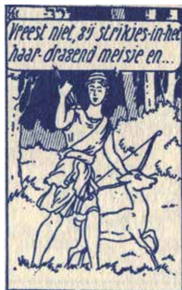
Willy Vandersteen De avonturen van Suske en Wiske, De Mottenvanger (voorpublicatie in krant 1948-1949)

Vandersteen, die een uitgesproken voorliefde koestert voor het roemruchte Vlaamse verleden, en de rebelse zestiende eeuw van Bruegel in het bijzonder, kijkt ook om zich heen. En merkt de Belgische surrealist René Magritte op. Zoals de surrealisten zich laten inspireren door droombeelden, zo laat Wiske op haar beurt de surrealist Magritte haar droom vormgeven. Aan het begin van De Bokkerijder heeft zij een nachtmerrie die tante Sidonie aan de ontbijttafel verklaart. Het schilderij La Tempête uit 1944 of een gelijkaardig werk van Magritte levert het motief van de handige plant. “Dat was nu komiek, zie!,” besluit Wiske.