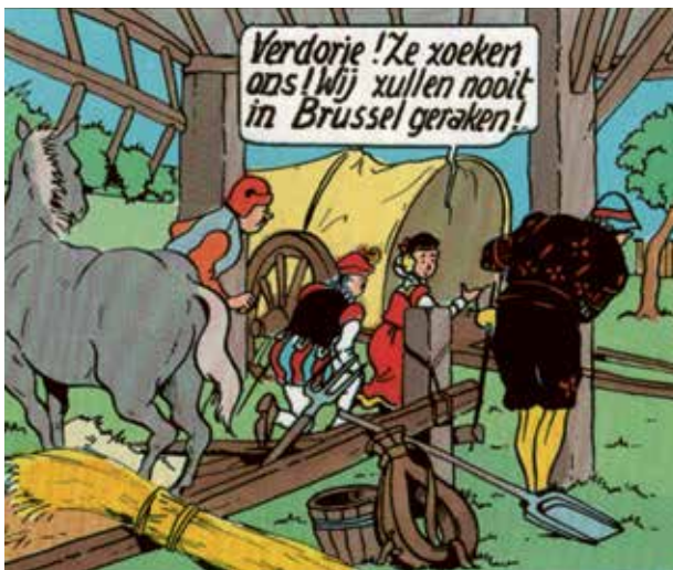
Willy Vandersteen De avonturen van Suske en Wiske, Het Spaanse Spook (voorpublicatie in Kuifje 1948-1950) De elegant geklede burger rechts is niemand minder dan Pieter Bruegel.

VAN BRUEGEL TOT MAGRITTE, EN TERUG Als onervaren striptekenaar kijkt Vandersteen gretig naar Amerikaanse strips om zijn eigen stijl vorm te geven. Maar ook de oude en recente beeldende kunst kruidt de avonturen van Suske en Wiske. Een drietal manieren van ontleening tekenen zich af. Allereerst documenteert Vandersteen zich. Zeker voor de verhalen die zich in het verleden afspelen, dient hij in de boeken te duiken. Soms schuilt het in een klein detail. Zo treft men in De Bokkerijder uit 1948 een wel heel precies getekend beeldje van Sint-Barbara aan. De heilige martelares is de patrones van de moeder van Johan Matheus Lambik, een voorvader van Lambik anno 1772. De silveren beeltenisse van de Heilige Barbara lijkt sprekend op het laatgotische beeld in de Sint-Monulphus- en Gondulphuskerk van het Limburgse Achel. Het is niet toevallig dat Vandersteen zijn oog liet vallen op een Limburgse Barbara. Mogelijk stoot hij tijdens zijn voorbereiding voor dit Limburgse avontuur op een afbeelding van deze fraaie sculptuur.