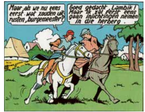
Willy Vandersteen De avonturen van Suske en Wiske, Het Spaanse Spook (voorpublicatie in Kuifje 1948-1950) Lambik en de burgemeester van Kriekbeek onderweg

Naast een rechtstreekse overname van een kunstvoorwerp laat Vandersteen zich ook inspireren door Vlaamse meesters. Zijn grote lieveling is Pieter Bruegel die met zijn schilderijen en gravures meermaals in Suske en Wiske opduikt. Een eerste keer tekent hij present in Suske en Wiske op het eiland Amoras (1945-1946). Het hoofdstadje van Amoras – gesticht in 1541 – herinnert dan weer sterk aan de fictieve stadswijk Oud Antwerpen op de Wereldtentoonstelling te Antwerpen van 1894. Enkele jaren later debuteert Vandersteen in het weekblad Tintin/Kuifje met Het Spaanse Spook (1948). Hier is het werk van Bruegel op talloze plaatjes te vinden, soms gemakkelijk te herkennen, nog vaker verborgen in een motief. Maar ook de Antwerpse grootmeester Peter Paul Rubens steekt hier een handje toe met zijn schilderij De verloren zoon uit het Koninklijk Museum voor Schone Kunsten te Antwerpen.