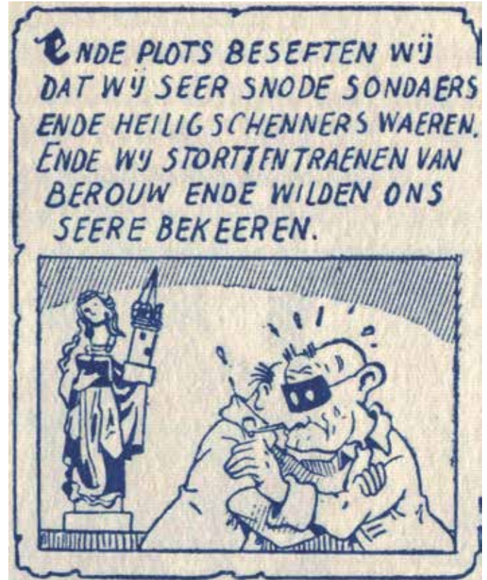
Willy Vandersteen De avonturen van Suske en Wiske, De Bokkerijder (voorpublicatie in krant 1948) © DE STANDAARD UITGEVERIJ 2020