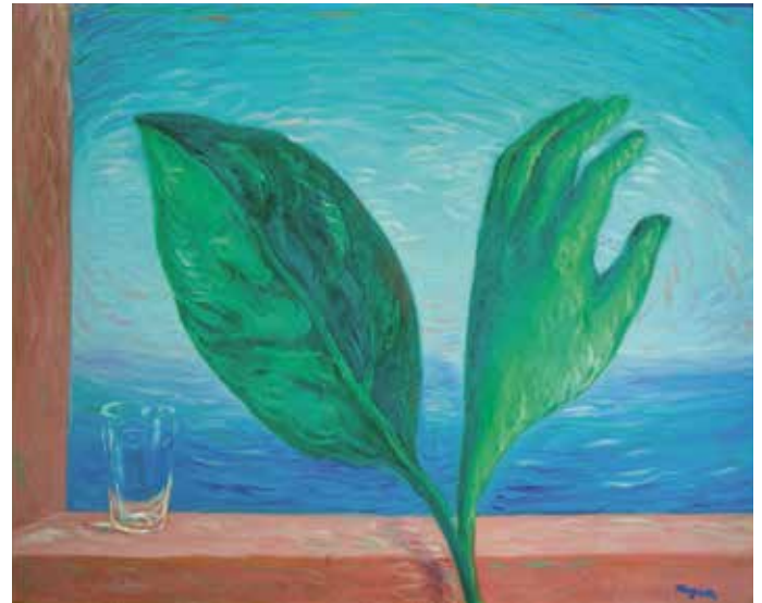
René Magritte, La Tempête , 1944 PORTLAND (MAINE, USA), PORTLAND MUSEUM OF ART