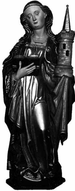
Meester van Varsseveld (Kalkar, D), Heilige Barbara van Nicomedië, ca. 1480-1490 Achel, Sint-Monulphus-en-Gondulphuskerk